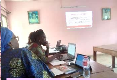
Formation sur la « protection de l'enfant »