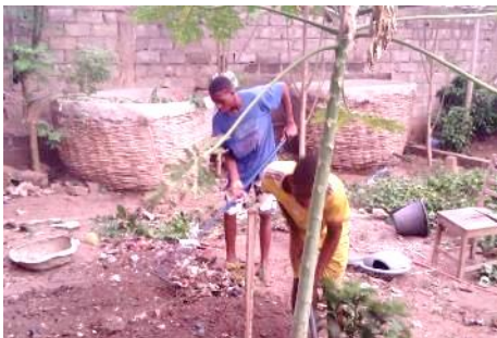
Nettoyage du jardin