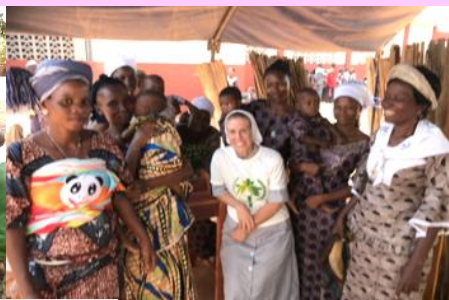
Célébration de la Vie.