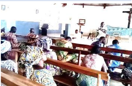
Formation sur Foi-Espérance-Charité