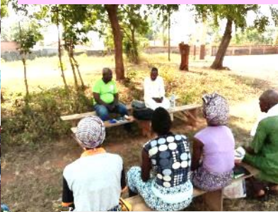
Animation sur le dialogue familial et communautaire