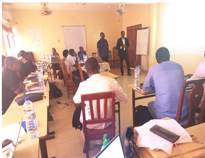
Présentation de la methologie par le consultant