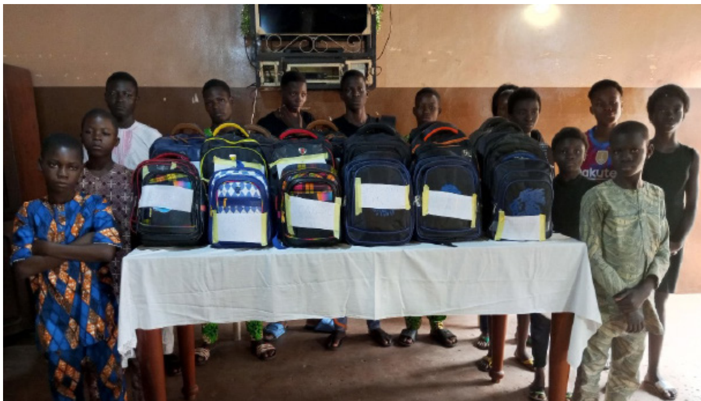
Les enfants des CEO prêts pour la reprise des classes

Vingt-deux écoliers et élèves des cours primaire, secondaire, de cuisine et restauration des Carrefours d'Écoute et d'Orientation (CEO) de Gbodjo et d'Akassato ont reçu des lots de kits scolaires pour la rentrée scolaire 2023-2024. D'un montant globale de 2.460.400 FCFA, obtenu grâce aux dons, ces kits sont composés de sacs, cahiers, stylos, crayon, ardoises, livres, etc.