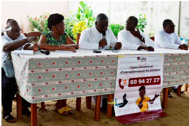
Les directeurs de la Caritas nationale, diocésaine et paroissiale avec la représentante du CRS

Par Vénérande N'KOUE (Direction Nationale)