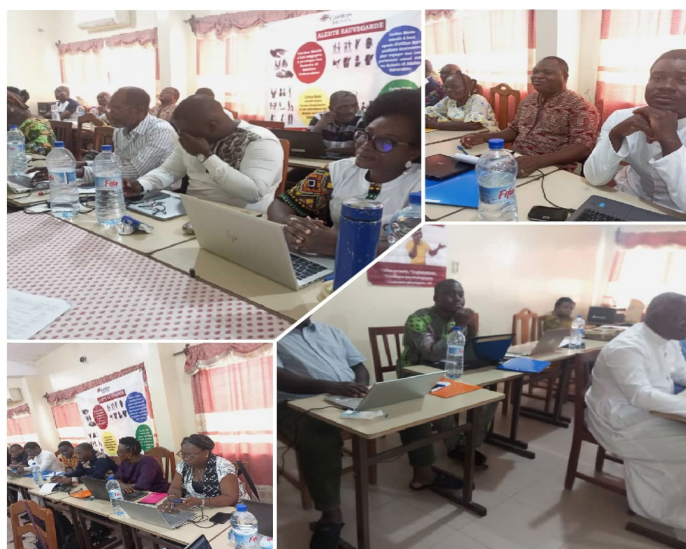
Les participants aux travaux

Caritas Bénin avec pour axes prioritaires : la communication sur l'identité de Caritas Bénin et le rôle primordiale des Évêques et curés de paroisses pour la promotion de l'identité ecclésiale de Caritas. Ainsi élaborer, le nouveau plan stratégique de Caritas Bénin, s'articule autour de 3 orientations stratégiques déclinées en 6 objectifs qui encadreront les futures actions de Caritas au niveau paroissial, diocésain et national pour le bien-être des personnes vulnérables. Ces rencontres ont pris fin sous la satisfaction des participants.