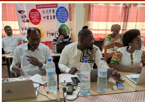
Les acteurs de Caritas Bénin donnent de nouvelles orientations à leur mission