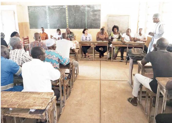
Echanges avec les enseignants

les groupements SILC, elle a pris connaissance du mode de fonctionnement de ces groupements (la plupart des membres sont des parents élèves) dont l'objectif est de contribuer à l'autonomisation financière de ses membres et au fonctionnement des cantines scolaires à travers la mise à disposition des condiments et autres pour l'alimentation des écoliers. Ces différentes rencontres lui ont permis de constater le fonctionnement de la cantine scolaire, le comportement des communautés bénéficiaires et le dispositif mis en place pour l'atteinte des objectifs de ce projet.