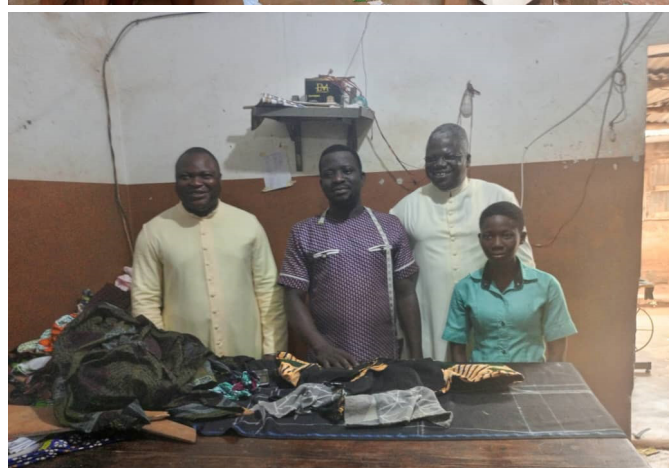
Visites sur les lieux de formation des filles-mères