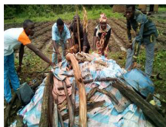
Fabrication du compost

biofertilisants liquides à base des feuilles et des ingrédients naturels comme l'ail, le piment, le tabac, les feuilles et ou les graines de neem etc. plutôt que l'utilisation d'intrants. Elles s'inspirent des multiples techniques culturelles traditionnelles transmises par des générations d'agriculteurs, toutefois perfectionnées. Ainsi, Caritas Natitingou a formé 773 agriculteurs et maraichers aux techniques agro écologiques telles que :