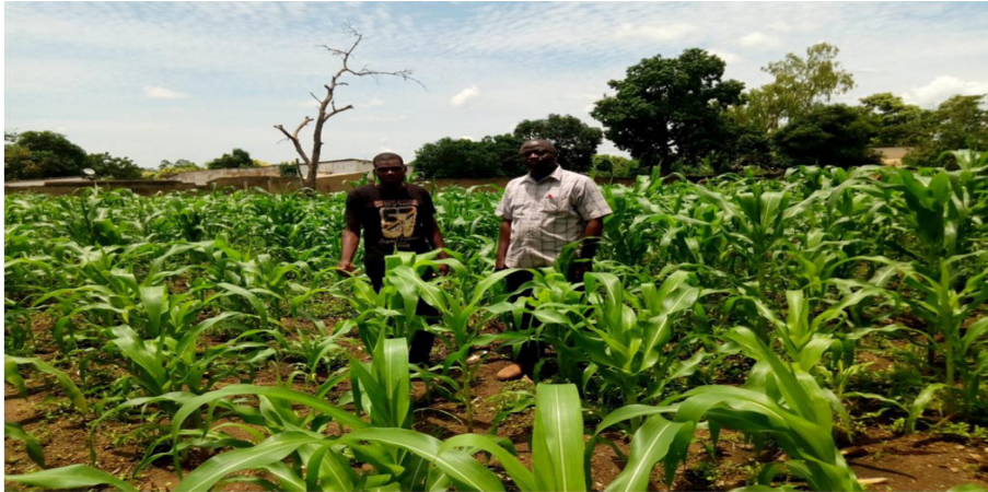
Champ de maïs bio

La pauvreté et l'insécurité alimentaire des populations particulièrement dans le monde rural sont causées par une faible productivité agricole due à l'infertilité des sols dû à l'usage massif d'intrants chimiques et des pesticides. Combinée aux effets des changements climatiques observés de nos jours, les populations rurales sont plongées dans une insécurité alimentaire chronique qui a des répercussions sur la santé de la majorité des familles rurales surtout les enfants.