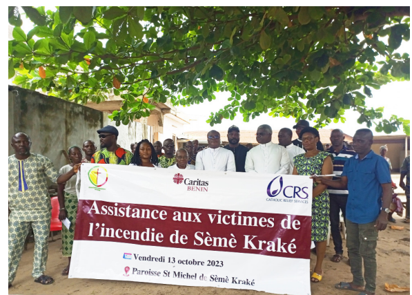
Les représentants des familles victimes avec les responsables de Caritas et CRS