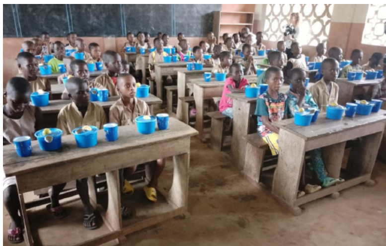
Le premier repas de l'année scolaire 2023-2024 est servi aux écoliers de l'EPP de Houingah

Il faut noter que Caritas Bénin intervient dans l'opérationnalisation des cantines scolaires au Bénin avec le PAM sur le Programme d'Alimentation Scolaire Intégrée dans environ 1. 000 écoles des départements du Borgou et Mono. Et, le CRS à travers le projet KEUN FAABA III (MGD21), dans les communes de Banikoara, Nikki et Sinendé, départements du Borgou et Alibori dans 167 écoles.