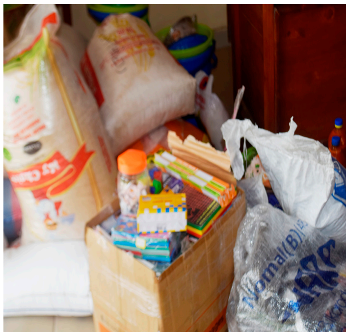
Les dons offerts par le groupe