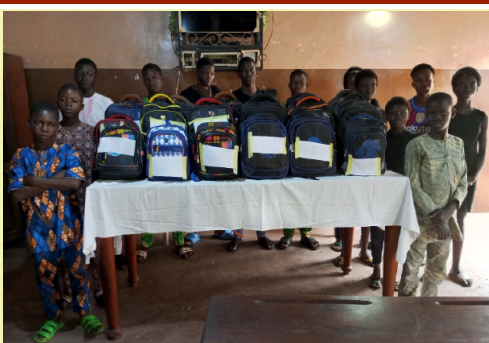
Caritas Cotonou offre des kits scolaires aux enfants en situations difficiles