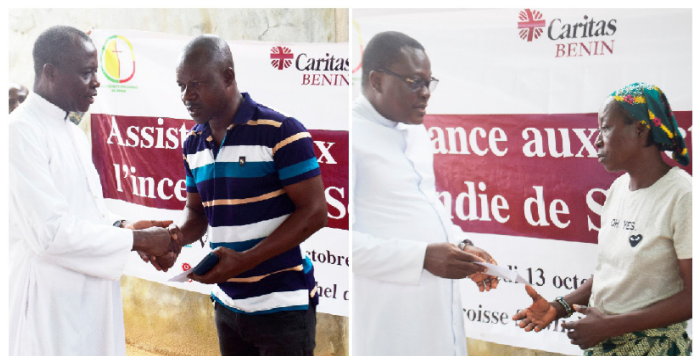
Remise d'assistance aux représentants des ménages par le curé de la paroisse de Kraké (à gauche) et le directeur diocésain de Caritas Porto-Novo (à droite)

Cette modeste contribution financière remise aux 46 ménages victimes permettra de subvenir aux besoins sanitaires des enfants de moins de 5ans et des femmes enceintes, alimentaire et la prise en charge sanitaire des victimes hospitalisées et à la scolarisation des enfants ou la formation des jeunes victimes. Ainsi, les ménages composés de 1 à 3 personnes ont reçu une somme de 90.000f CFA, les ménages de 4 à 5 personnes 105.000f CFA, les ménages de 6 à 9 personnes 110.000f CFA et les ménages ayant plus de 9 personnes 115.000f CFA. En plus de l'assistance financière, Caritas Bénin et son partenaire offre un appui psychologique aux victimes.