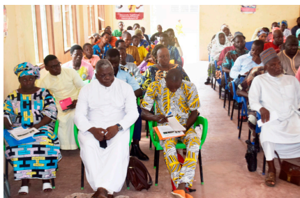
Vue partielle des participants à Kandi

Après trois ans de mise en œuvre du projet de réinsertion socio-professionnelle des Enfants en Situation de Mendicité financé par KinderMission dans les communes de Djougou et Kandi, Caritas Bénin a fait le bilan de la 2e phase au cours des ateliers de redevabilité tenus, le 12 à Djougou et le 14 septembre 2023 à Kandi en présence des différentes parties prenantes.