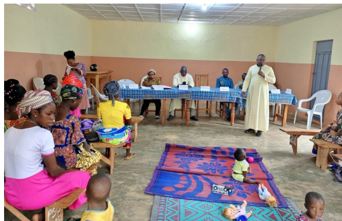
Echanges avec les filles-mères

Dans chaque diocèse, la mission a démarré par des visites aux Evêques qui sont les présidents des Caritas diocésaines puis des directeurs diocésains de ces