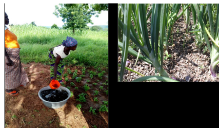
Utilisation du biofertilisant liquide dans un champ d'oignon

En effet, les techniques agro écologiques s'appuient sur le recyclage des éléments nutritifs et de l'énergie sur place c'est-à-dire le compost solide, le paillage, l'utilisation des biopesticides et des biopestifuges, et des