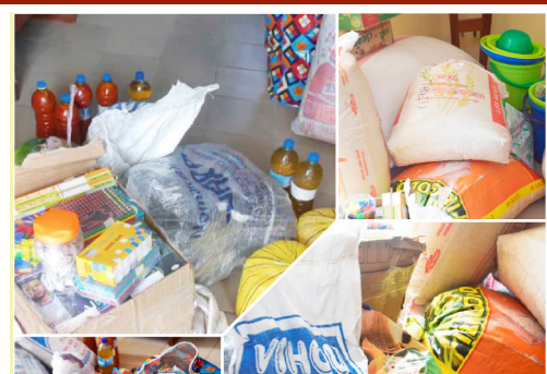
Le groupe d'intercession « Jésus-Marie » dévoué pour les pauvres