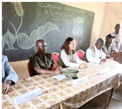
Le Directeur national de Caritas Bénin aux côtés de la directrice adjointe du PAM et des autorités locales