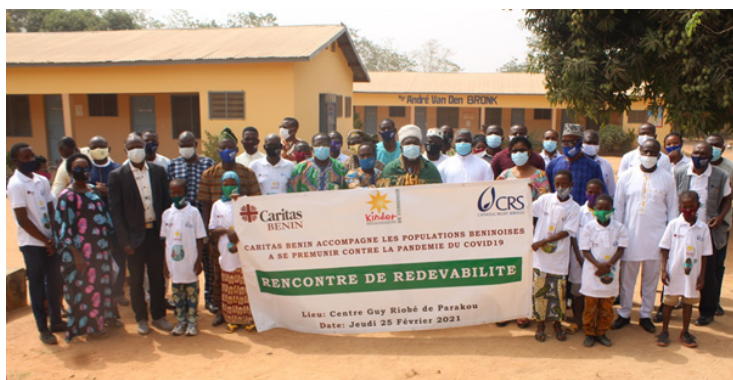
Photo des participants à l'atelier de redevabilité