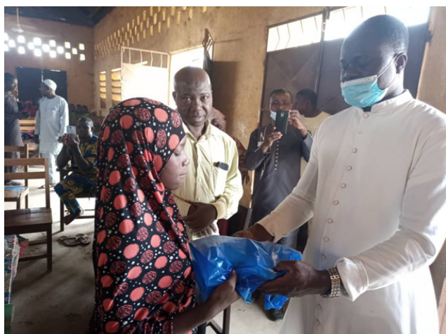
Remise de Kits d'apprentissage par le Directeur de Caritas Djougou