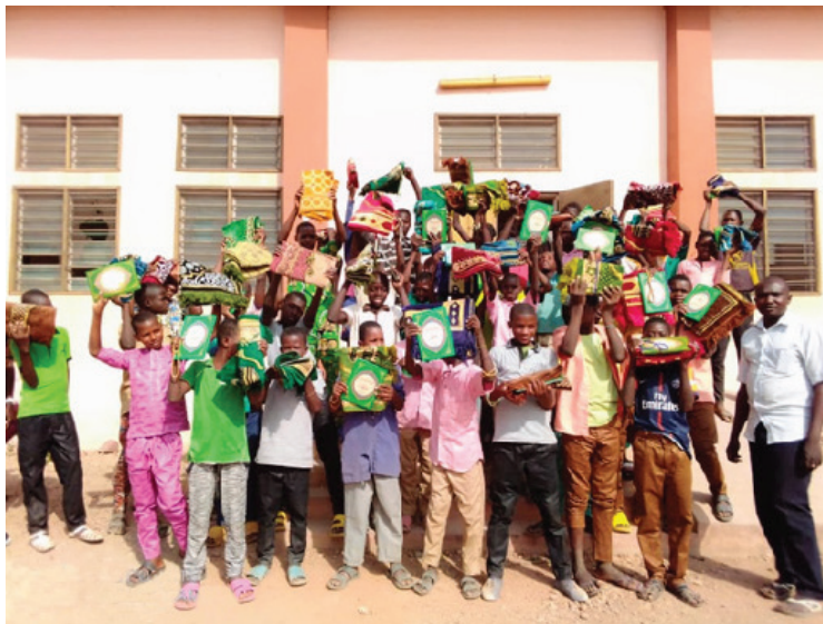
Photo des ESM avec leurs kits d'apprentissage à la vie spirituelle