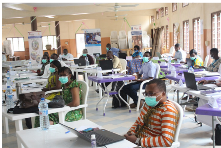
Vue partielle des Participants à l'atelier de formation

Au terme de cet atelier de cinq jours, les délégués, ont amélioré leur connaissance en matière de Conception et Gestion de Projet. Les notions, approches et outils abordés durant la formation ont permis le partage d'expériences. Satisfaits des acquis de la formation, les participants ont reconnu son opportunité et ont salué le leadership de Caritas-Bénin et CRS. Les délégués ont pris l'engagement de se conformer aux normes et standards de gestion des partenaires techniques et financiers. Une exigence qui prend désormais en compte les besoins réels des populations, permet une mise en œuvre avec succès des stratégies et offres des changements positifs et durables dans la vie des populations.