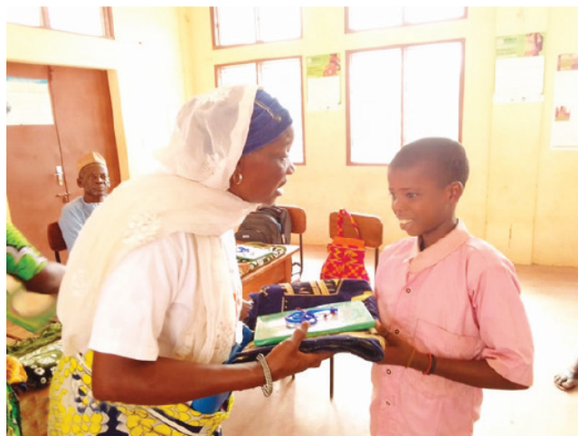
Photo de remis de kits d'apprentissage à la vie spirituelle au ESM

En cette période de carême où nous sommes invités à prendre soin de nos frères et sœurs souffrants, Caritas Bénin a dans le cadre de la mise en œuvre du projet de réinsertion des Enfants en Situation de Mendicité (ESM) procédé le jeudi 04 mars 2021 dans la salle de réunion du Centre de Promotion Social de Kandi, à la remise de kits (Bible, Coran, Chapelet, Tapis) d'apprentissage à la vie spirituelle à cinquante-cinq (55) Enfants en Situation de Mendicité.